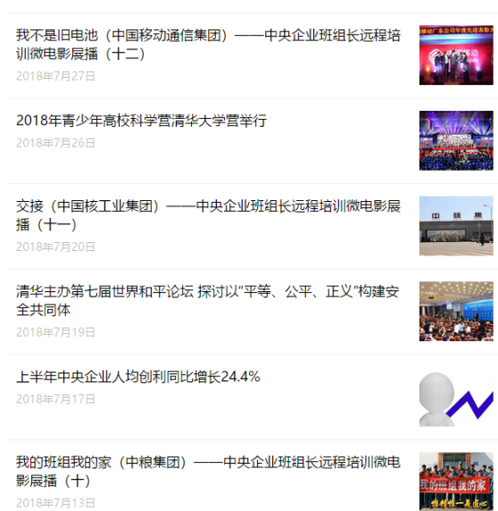
图为公众号日常推送

除了发布最新的校内活动、央企的发展情况之外，清华班组长学堂还推出了“中央企业班组长培训教学微电影”专栏，将已制作好的30部中央企业班组长远程培训教学微电影一一展示。这些微电影作品以班组管理实际案例为原型，聚焦班组管理的具体内容，发现和解决班组管理中的问题，阐述管理提升的思路和方法，集中展示了班组管理提升的经验和效果。