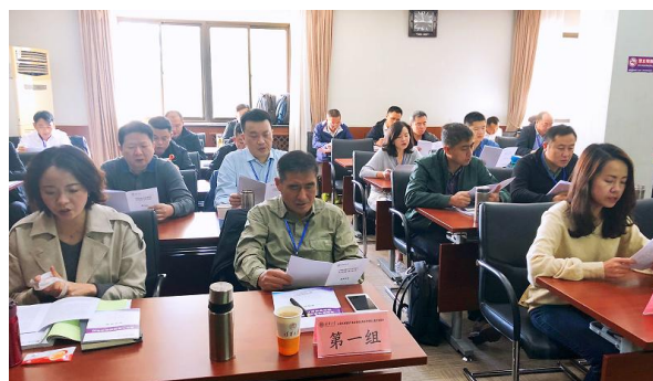
图为晨读时光剪影